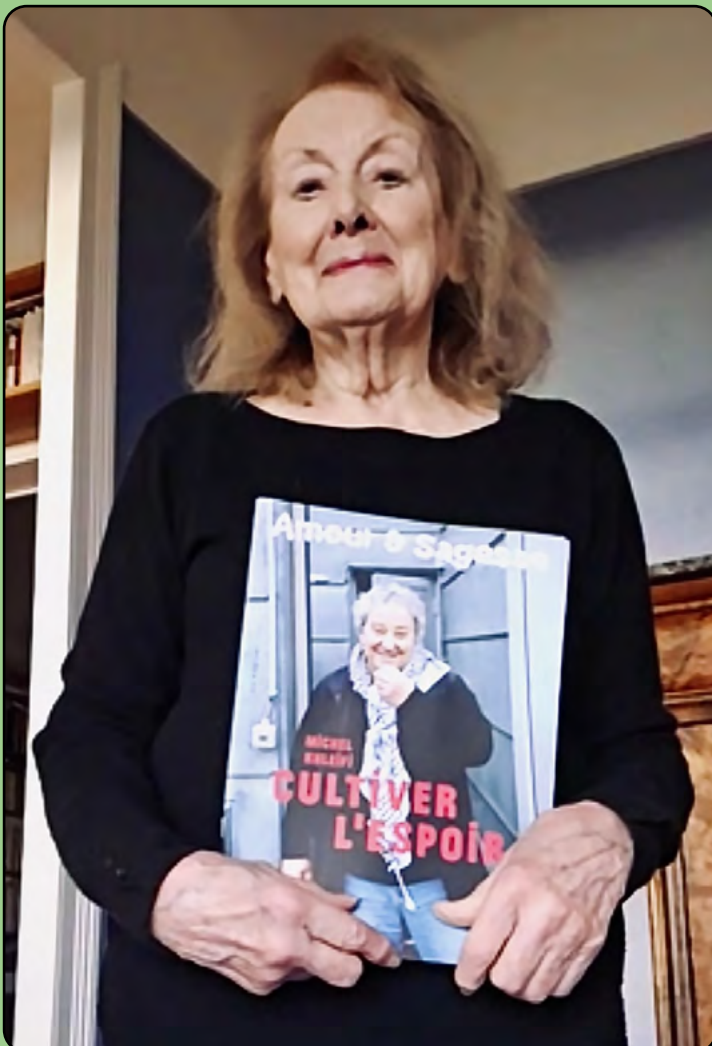
Photographie de couverture : Vincen Beekman, 2° de couverture : Atelier méli-mélo, photographie de 3° de couverture : Jarini Husquet, broderie de 4° de couverture et page 5 : Odette Alves