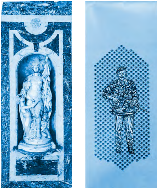
La Belgique apportant la sécurité au Congo revisitée par Jean-Pierre Müller.

a-t-il réellement entamé un processus de décolonisation ou est-il encore glorificateur de cette période sombre de notre histoire ?